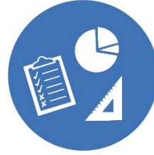
Planificación, Monitoreo y Evaluación