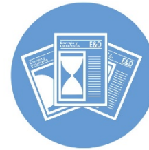
Revista Energía y Desarrollo - E&D