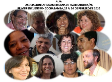
Equipo coordinador Asociación Latinoamericana de Facilitadores. 2010 - fecha