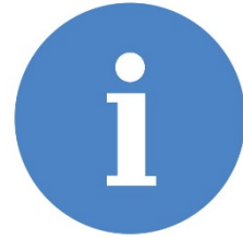
Gestión de Información