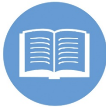
Elaboración de Documentación y Material Impreso