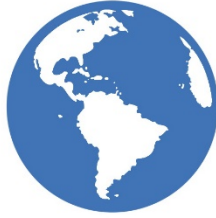
Ambiente y Derechos Humanos