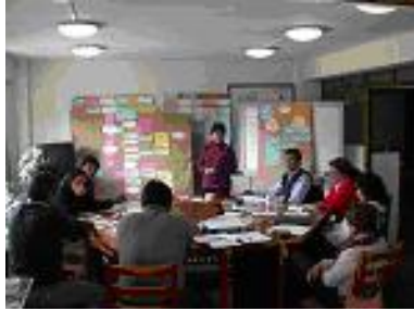
Trabajo en equipo.